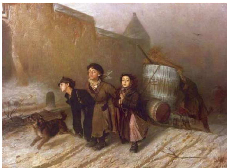
В. Перов. «Тройка»

Задание 10. Установите соответствие между описанием и названием сказки.