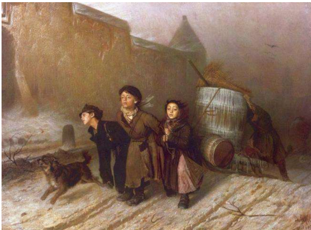
В. Перов. «Тройка»

Выберите из предложенных статей Конвенции о правах ребёнка ту статью, которая нарушена. Ответ укажите цифрой.